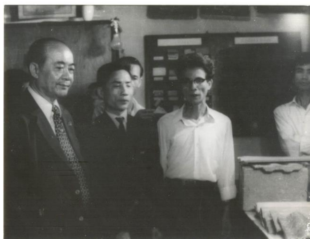
Chuyên gia thăm và làm việc với Bộ môn Công nghệ Vật liệu Silicát