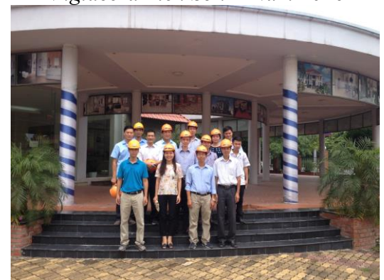
Các Thầy Cô Bộ môn Công nghệ Vật liệu Silicát thăm và làm việc tại Công ty Cổ phần Viglacera Thăng Long - Năm 2016