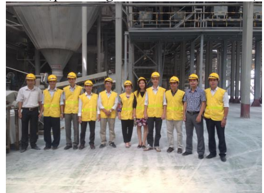
Thầy Cô Bộ môn Công nghệ Vật liệu Silicát thăm và làm việc tại Công ty Cổ phần Viglacera Tiên Sơn - Năm 2016