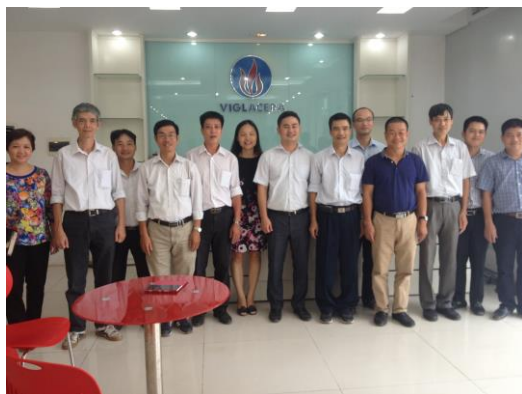
Các Thầy Cô Bộ môn Công nghệ Vật liệu Silicát thăm và làm việc tại Công ty Cổ phần Viglacera Hà Nội - Năm 2016