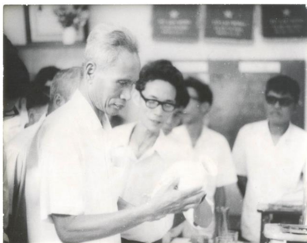
Thủ tướng Phạm Văn Đồng thăm Bộ môn Công nghệ Vật liệu Silicát - Năm 1969