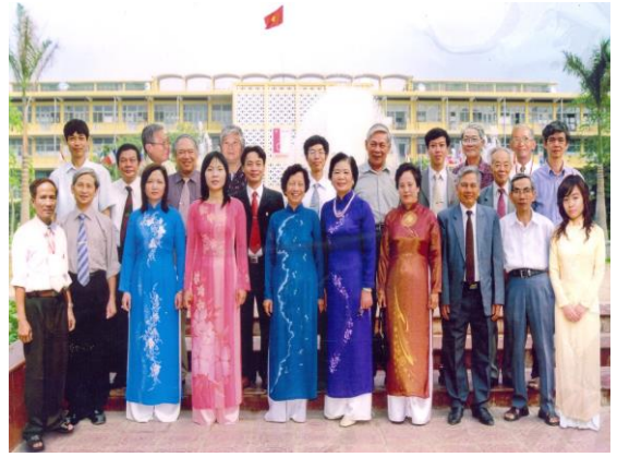
Hình ảnh một số Thầy, Cô Bộ môn Công nghệ Vật liệu Silicát nhân kỉ niệm 50 năm thành lập Trường ĐH Bách Khoa Hà Nội